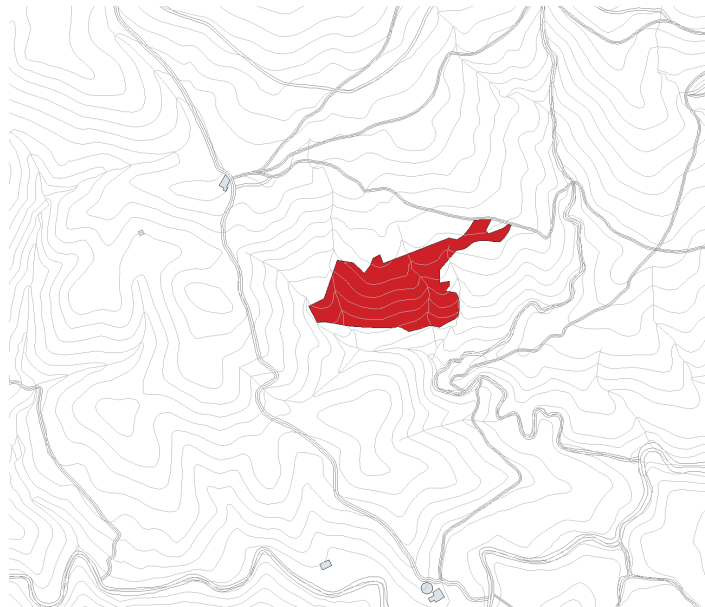
Finca rústica Pol 6 Parc 35