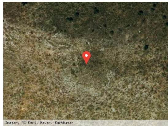
Vista Satélite (Zoom)