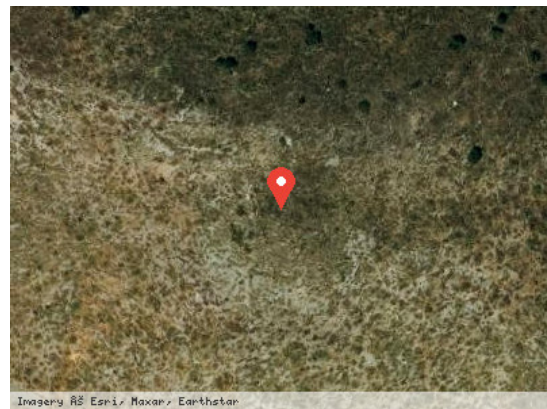
Imagery ©S. Esri, Maxar, Earthstar Vista Satélite (Zoom)