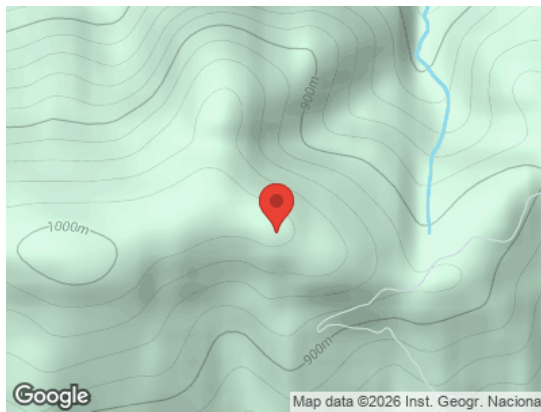
Vista General (Terreno)