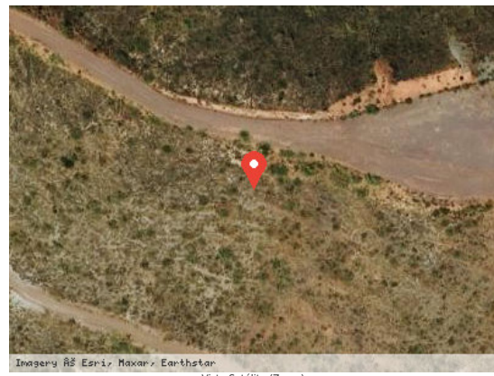
Vista Satélite (Zoom)