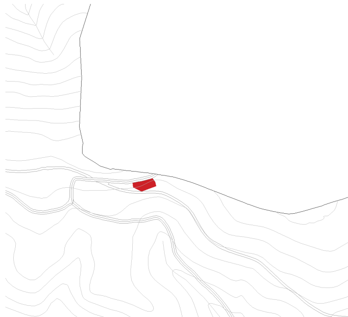
Finca rústica Pol 6 Parc 11