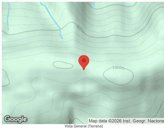
Vista General (Terreno)