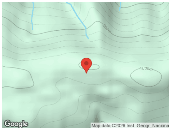
Map data ©2026 Inst. Geogr. Nacional Vista General (Terreno)