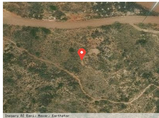
Imagery ©S. Earth, Maxar, Earthstar Vista Satélite (Zoom)