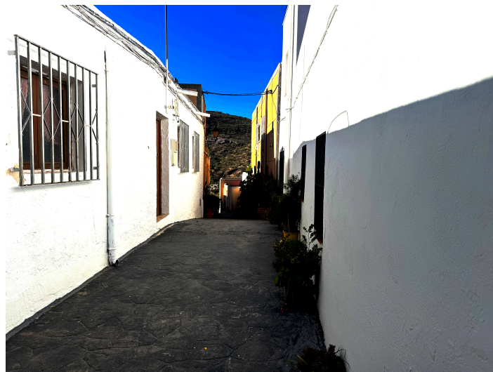
Calle Antonia Jesús Arrieta Cuadrado