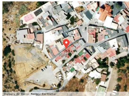
Vista Satélite (Zoom)