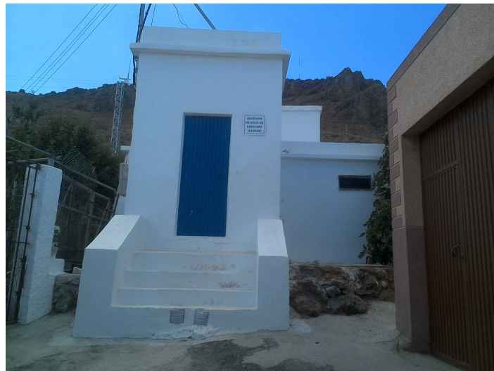
Depósito de agua