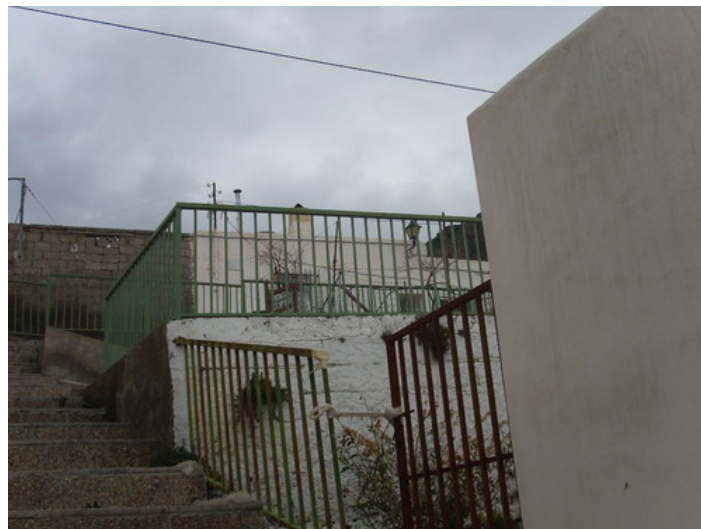
Solar en Calle Juan López Molina