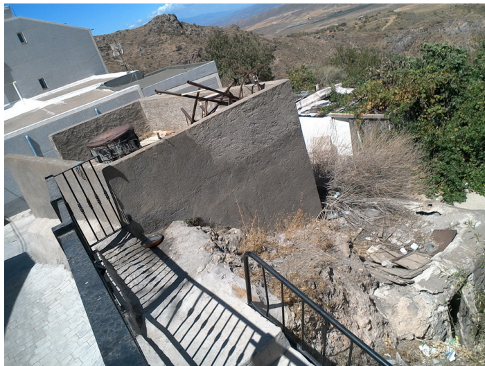
Almacén en Calle Tabernas