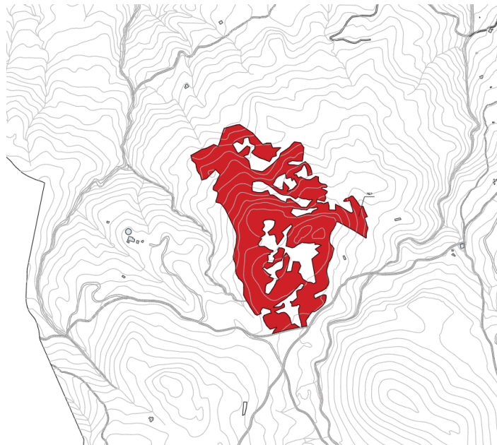
Finca rústica Pol 12 Parc 42