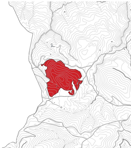
Finca rústica Pol 12 Parc 24