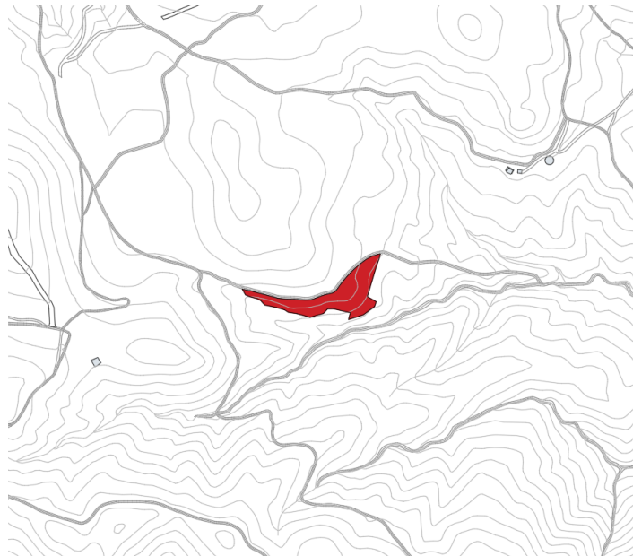
Finca rústica Pol 10 Parc 36