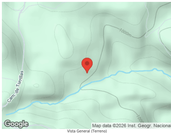
Vista General (Terreno)