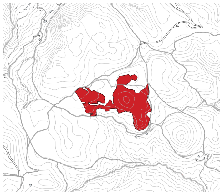
Finca rústica Pol 10 Parc 24