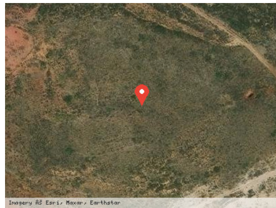
Vista Satélite (Zoom)