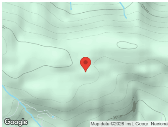
Vista General (Terreno)