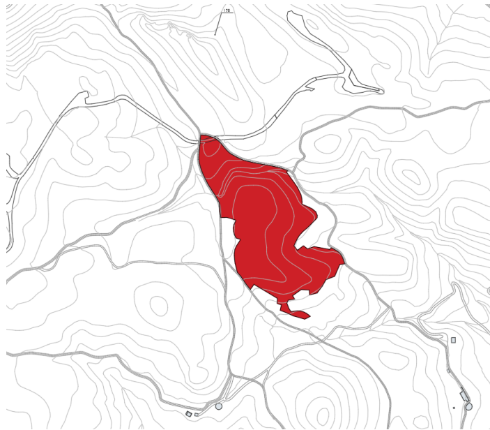
Finca rústica Pol 8 Parc 71