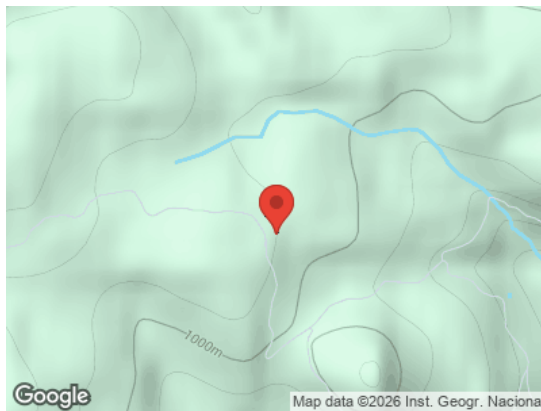
Map data ©2026 Inst. Geogr. Nacional Vista General (Terreno)