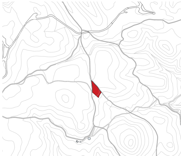
Finca rústica Pol 8 Parc 69