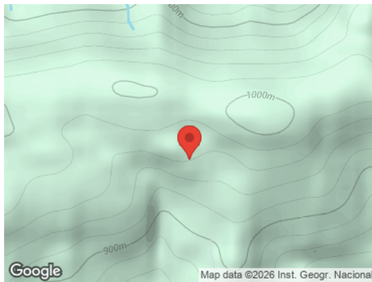
Vista General (Terreno)