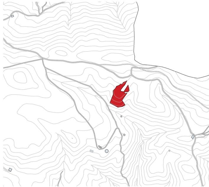
Finca rústica Pol 8 Parc 40