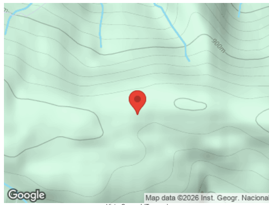
Vista General (Terreno)