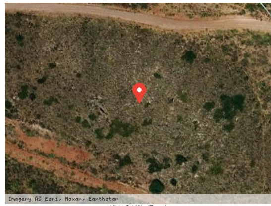
Vista Satélite (Zoom)