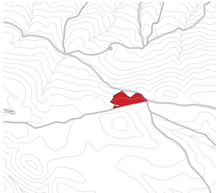
Finca rústica Pol 8 Parc 36