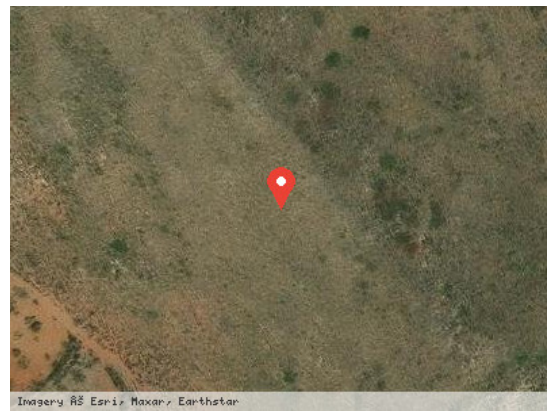
Earthstar Vista Satélite (Zoom)