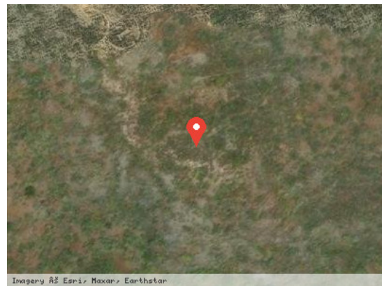
Imagery © ESRI, Maxar, Earthstar Vista Satélite (Zoom)