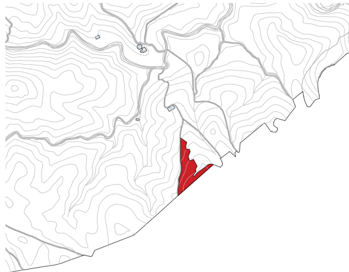
Finca rústica Pol 7 Parc 27