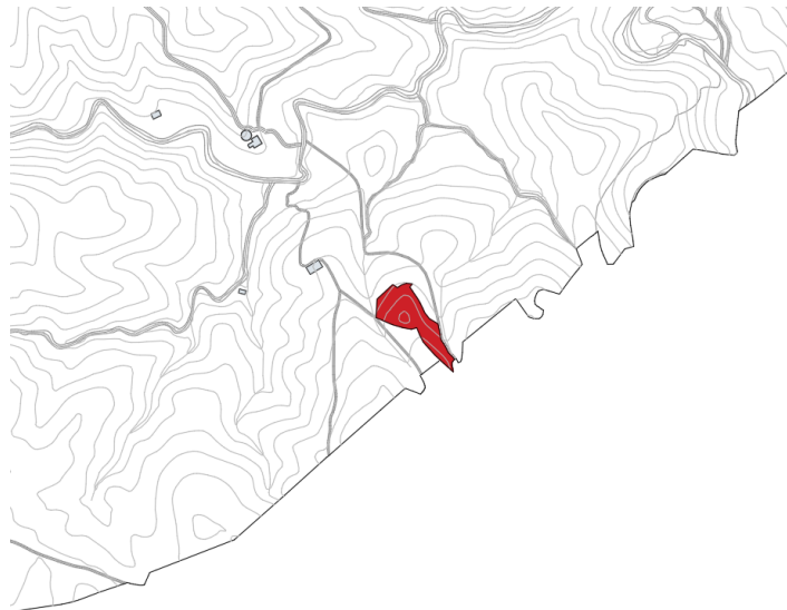
Finca rústica Pol 7 Parc 23