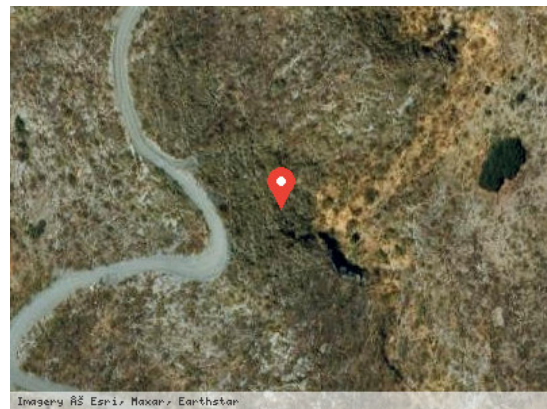
Imagery © Esri, Maxar, Earthstar Vista Satélite (Zoom)