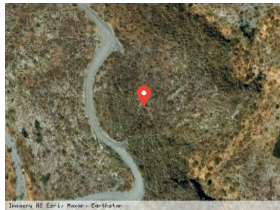
Imagery ©S. Esri, Maxar, Earthstar Vista Satélite (Zoom)