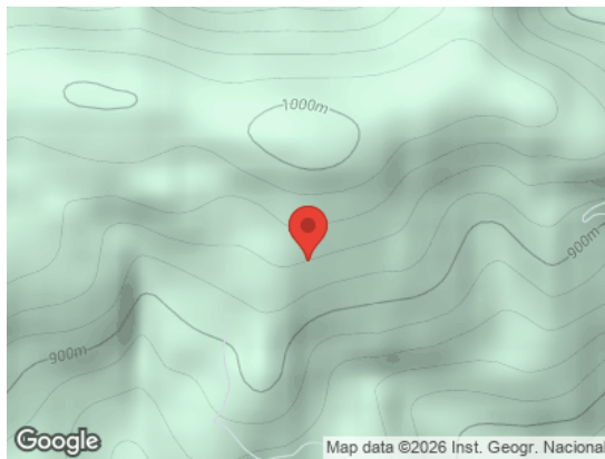
Vista General (Terreno)