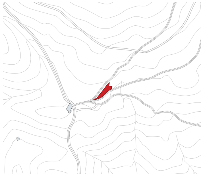
Finca rústica Pol 6 Parc 48