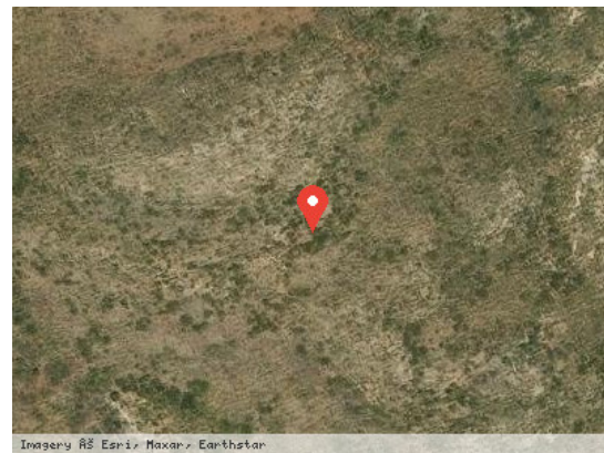
Imagery ©S Earth Maxar Earthstar Vista Satélite (Zoom)