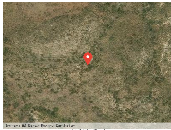
Vista Satélite (Zoom)